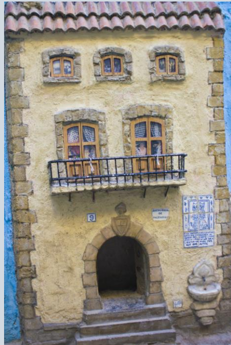
LA CASA DE LOS GATOS