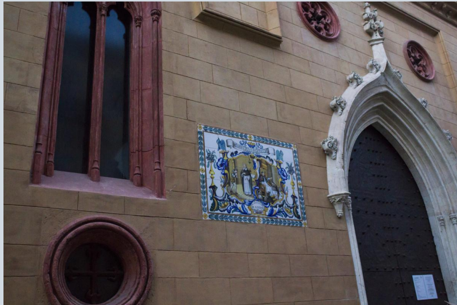
IGLESIA DE SANT NICOLAU